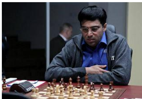
Gelfand, Boris (2739) vs. Anand, Viswanathan (2799)